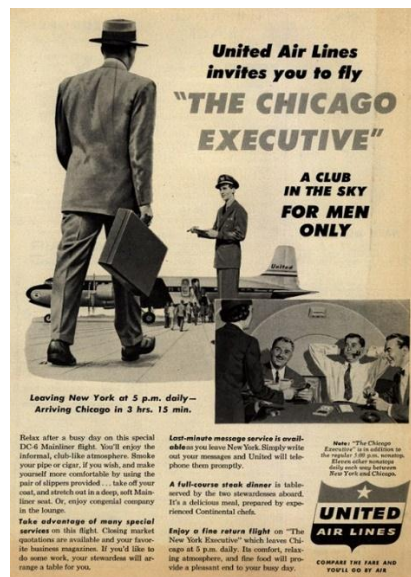
صورة رقم (11) تمثل إعلان للرجال فقط لشركة الخطوط الجوية المتحدة United Airlines

الخطوط الجوية المتحدة United Airlines التي كانت رحلاتها للرجال فقط حتى عام 1970، والتي استقطبت في أقل من عام 1950 مسافر؛ جعل هذا استراتيجية التسويق هذه ناجحة بشكل لا يصدق، وظهرت الفكرة لأول مرة في أوائل الخمسينيات من القرن الماضي واستمرت حتى أوائل السبعينيات كما يظهر من الصورة رقم (11) (Mental Floss, 2021)