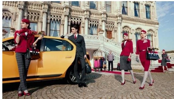
صورة رقم (20) تمثل أزياء طاقم الخطوط الجوية التركية Turkish Airlines عام 2018 (CNN العربية، 2018)

وكشفت الخطوط الجوية التركية النقاب عن تصاميم موحدة لموظفي شركة الطيران في عام 2018 كما في الصورة رقم (20) تزامنا مع افتتاح مطار اسطنبول الجديد، المستوحى من العاصمة، لطلما كانت إسطنبول مركزاً تصادمت فيه الحضارات والفنون وتتشترك في تراث فريد مع الحضارات الأخرى (CNN العربية 2018)