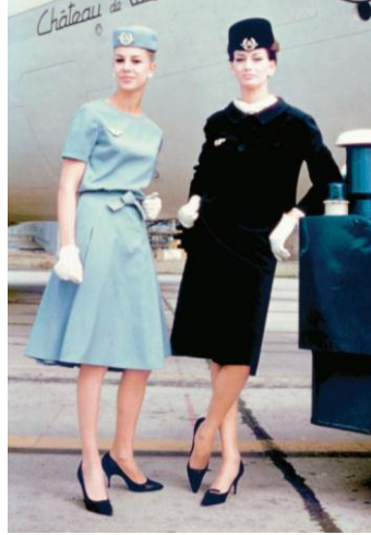
صورة رقم (7) تمثل زي مضيفات الخطوط الجوية الفرنسية Air France عام 1962

(Fashion In Flight: A History of Airline Uniform Design, 2016)