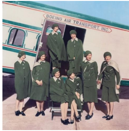
صورة رقم (3) تمثل زي أول طاقم طائرة مساعد نسائي لدى شركة بوينغ للنقل الجوي Boeing Air Transport

وقد توج التاريخ ظهور أول مضيضة طيران في العالم إيلين تشرش Ellen Church عام 1930 (Omelia & Waldock, 2003). تشيرش الممرضة، إلى جانب سبع ممرضات خضعن للتدريب ليصبحن مضيفات موضح في صورة (3) (بحران، 2017). وقد ارتدين مضيضات الرحلة زي موحد يتكون من بدلة رسمية مع قبعة الممرضات حتى يتمكنوا من تقديم صورة احترافية للركاب (Omelia & Waldock, 2003).