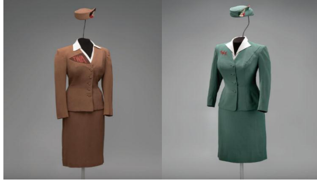
(("Fashion In Flight: A History of Airline Uniform Design", 2016)

وبسبب خروج النساء للمهن الذكورية هيمنت قصات البذل العسكرية على الموضة العالمية، وبعد انتهاء الحرب العالمية الثانية، عادت السيدات للقصات الأنثوية وبدأت اتجاهات الموضة الراقية (أحمد وزغلول، 2007؛ ساروخ، 2012؛ Fashionary, 2019). وتبنت غالبية شركات الطيران هذه الاتجاهات التي سادت خلال الخمسينيات وحملت إلى السماء وكانت أغلب شركات الطيران تقدم أزياء لفصلي الشتاء والصيف مختلفة عن بعضها كما في الصورة رقم (6)