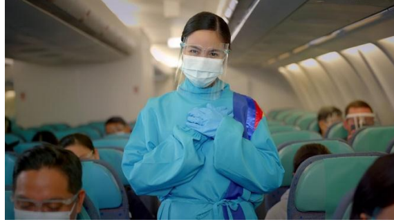
صورة رقم (21) تمثل أزياء طاقم الخطوط الجوية الفلبينية Philippine Airlines عام 2020 (Philippine Airlines, 2021)

حتى عام 2021، استمرت تأثيرات جائحة COVID-19 على قطاع الطيران على الرغم من الانتشار العالمي لبرامج التطعيم، وفتح الحدود، واستئناف رحلات الركاب. (Love Exploring, 2021, para. 55).