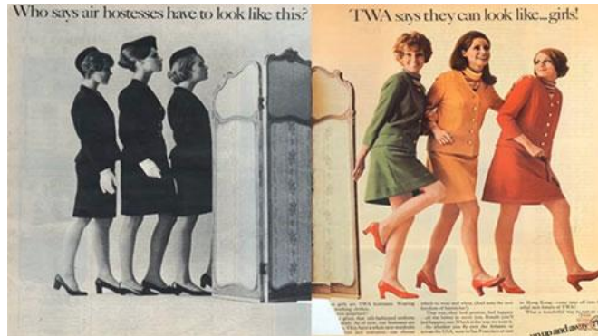
صورة رقم (9) تمثل إعلان في منتصف الستينيات لخطوط ترانس وورلد الجوية Trans World Airlines (National Clothing, n.d)

بمجرد وصولنا إلى منتصف الستينيات، تطورت ملابس المضيفات لألوان مشرقة ومبهجة ورُمز لها بإعلان (National Clothing, n.d., para 25) خطوط ترانس وورلد الجوية