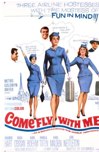
صورة رقم (8) تمثل ملصق إعلاني لفلم تعال وحلق معي Come Fly with Me

من خلال إعلان ظهر عام 1963 لفلم تعال وحلق معي Come Fly with Me والذي تدور أحداثه في طائرات خطوط بان أمريكي Pan American، كما يظهر من خلال الصورة رقم (8)، ويتضح من خلال الإعلان والعبارات المرفقة ترويجا لأفكار غير مهنية وترسيخ نظرة مجتمعية غير سوية لدور المرأة في مهنة الضيافة الجوية (Imdb, n.d.). تتلخص أحداث الفلم حول ترويج أن المضيفات يبحثن عن رجال أثرياء في رحلاتهم الجوية ويؤكد ذلك قوة تأثير الإعلام وتراكم تأثيره عبر السنين (Levin, 1963).