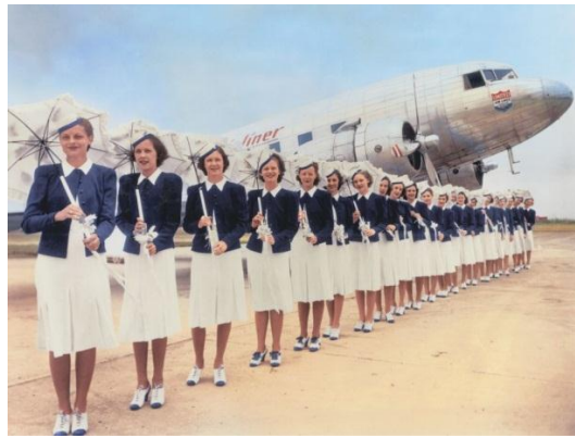
صورة رقم (4) تمثل زي مضيفات الخطوط الجوية المتحدة United Airlines عام 1939 (هي، 2016)

ظهرت فكرة استخدام مضيفات طيران للإعلان عن الرحلات الجوية لأول مرة في الأفلام السينمائية عام 1933، مثل فلم Air Hostess ، وقد تم الترويج للفكرة لاستهداف الجماهير من خلال مشاهد توشي بأن المضيفات عشيقات، ومنذ ذلك الحين استخدام النساء كصور ترويجية لشركات الطيران (Rogell,1933). في أواخر الثلاثينيات تم تقديم الزي الأول ذو الطابع الموسمي المميز، مبتعدًا عن تصميم الزي الرسمي التقليدي كما في الصورة رقم (4) (The United airline historical Foundation, n.d., para 9).