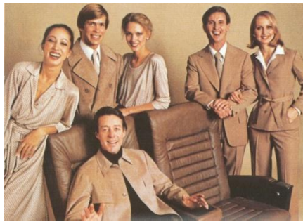
صورة رقم (13) تمثل أزياء طاقم طائرات خطوط برانيف الدولية عام 1977

بعدها تم توظيف الرجال وإعطائهم زيا رسميا، أما عن العقود السابقة فقد كان عددهم قليل جدا في منصب رؤساء الطاقم، وطوال الحرب العالمية الثانية، سيطرت النساء على المهنة (National Clothing, n.d., para. 31). على الرغم من حقيقة أن الاحتجاجات والإجراءات القانونية ضد التمييز والحركات النسوية كان لها التأثير الأكبر على التحول الجذري الذي شهدته أزياء الطاقم في ذلك الوقت، إلا أن هناك عناصر مهمة أخرى ساهمت في هذا التغيير؛ بحلول منتصف السبعينيات، لم يكن رجال الأعمال غالبية المسافرين، بل بدأ عدد المسافرين من الإناث والأطفال في الارتفاع، ولم تعد فكرة التسويق السابقة فعالة في ذلك الوقت، لذلك كان على شركات الطيران تغيير استراتيجياتها التسويقية والتركيز على تسويق الأمن والسلامة، ودعت هذه الاستراتيجيات إلى التغيير الكبير في زي الطاقم ليكون أكثر احتشاما ورسمية كما في الصورة رقم (13) (Daily Mail, 2017).