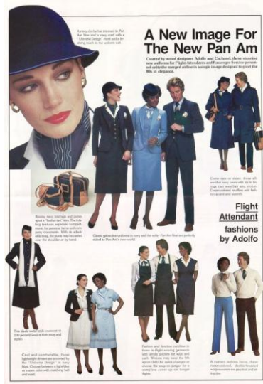
صورة رقم (14) تمثل أزياء طاقم طائرات خطوط بان أمريكان عام 1980

في أوائل الثمانينيات قامت بعض الشركات بترقية زي الطاقم من خلال إضافة صدرات إلى أسفل المعطف كما في الصورة رقم (14) (Everything pan am, n.d.)