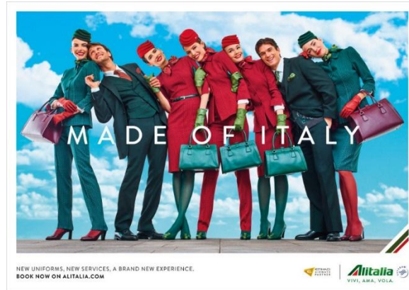
صورة رقم (19) تمثل أزياء طاقم طائرات الخطوط الجوية الإيطالية Alitalia Airways عام 2016 (Alejandra And Marco, n.d.)

Alitalia Airways ، التي أثارت الحنين إلى الخمسينيات والستينيات من القرن الماضي ولكنها أضافت لمسة إيطالية مميزة، في عام 2016 كما في الصورة رقم (19) (The Design Air, 2016, para. 1,2,3).