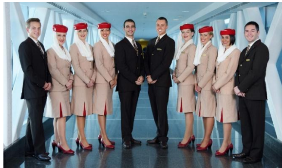
صورة رقم (18) تمثل أزياء طاقم طيران الإمارات منذ 2009

ويعد زي طاقم طيران الإمارات، الذي تم تغييره آخر مرة في عام 2009 ولا يزال يحتل مكانته كواحد من أفخم الأطقم اليوم من خلال القصات والألوان، نقل مصمم الأزياء سيمون جيرسي Simon Jersey مُثّل الأناقة والرفي التي تميز طيران الإمارات كما في الصورة رقم (18) (Simon Jersey, n.d., para. 1,2).