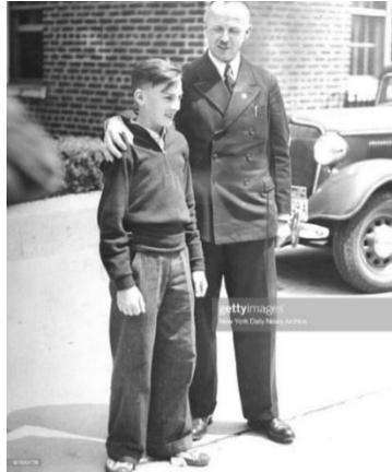
صورة رقم (1) تمثل زي أول مضيف جوي ألماني هاينرش كوبيس Heinrich Kubis

منذ ظهور الطيران التجاري، لعبت ملابس طاقم الطيران المساعد دوراً مهماً في تاريخ الموضة، كانت هذه المهنة بمثابة تمثيل مرئي للعلامة التجارية لشركة الطيران ودلالة على المهام المحددة التي يشغلها أفراد الطاقم في أماكن عملهم (The Ultimate Fashion History, 2020). كانت الرحلة الأولى في عام 1912 بمثابة بداية الضيافة الجوية الذي بدأها هاينرش كوبيس Heinrich Kubis، أول مضيف جوي ألماني في التاريخ، وكانت مسؤوليته تقديم وجبات الطعام للعملاء، على متن شركة الطيران الألمانية ديلاج Delag (Aerotime, 2016). بدأ زي مضيفي الطيران كبدلات رسمية سوداء اللون (TheTravel, 2020). مثل كل رجل أعمال آخر في العقد الثاني من القرن الحادي والعشرين، كان يرتدي ملابس مماثلة لملابس النوادل، موضحة في صورة (1) (National Clothing, n.d., para. 3).