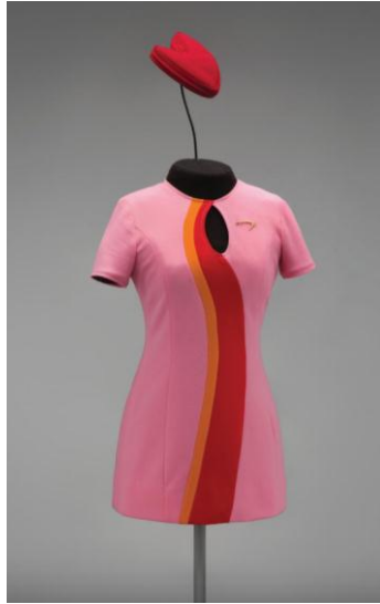
صورة رقم (10) تمثل زي مضيفات خطوط جنوبي غرب المحيط الهادئ الجوية Pacific Southwest Airlines

(Fashion In Flight: A History of Airline Uniform Design, 2016)