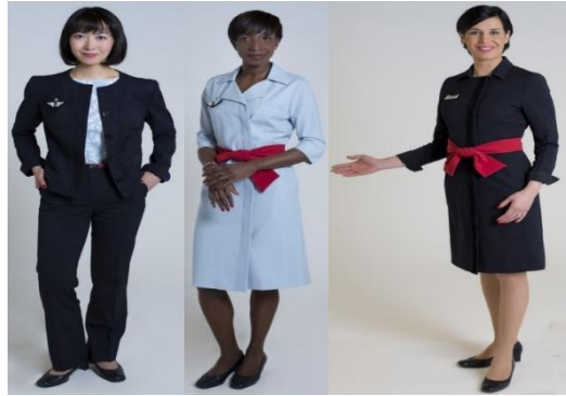
صورة رقم (17) تمثل زي مضيفات الخطوط الجوية الفرنسية Air France منذ 2005

مرت صناعة النقل الجوي بتحول كبير بعد أحداث 11 سبتمبر 2001. وبينما كانت الإجراءات الأمنية على متن الطائرات أقل صرامة بشكل ملحوظ قبل الهجمات الإرهابية في الولايات المتحدة، تغير كل شيء فور وقوع الحادث المأساوي. (سفر جوي إلى الماضي، 2017). نتيجة لذلك، شهدت صناعة الطيران في الولايات المتحدة أعلى خسارة اقتصادية، وطبقت العديد من شركات الطيران الأمريكية الأخرى تدابير لخفض التكاليف بينما أعلن بعضها إفلاسها؛ وسببه هو قيام العديد من المسافرين بتقليل السفر أو تجنبه (Ito & Lee, 2005). أتاحت هذه الأزمات فرصة لإعادة تصميم ملابس طاقم الطائرة بشكل مختلف لكل شركة طيران، (National Clothing, n.d., para. 50). خضعت خزانة ملابس طاقم الخطوط الجوية الفرنسية لتغيير كبير في مطلع الألفية من حيث الانسجام والتناغم بين قطع الأزياء والرغبة في إعادة تقاليد الأزياء الراقية الفرنسية الواضحة في صورة رقم (17) (Aqui em cima, 2012, para. 7).