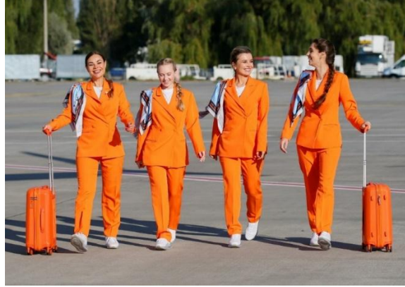
صورة رقم (22) تمثل أزياء خطوط طيران سكاى اب Sky Up Airlines عام 2021