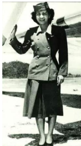
صورة رقم (5) تمثل زي مضيفة بمظهر حربي عام 1946 لدى شركة طيران كاثي باسيفيك Cathay Pacific (Rediscover the Cx Uniforms,2012)

يعد انعكاس الطاقم للاتجاهات السائدة على مدار العقود المختلفة أحد أهم جوانب تاريخ الموضة (The Ultimate Fashion History, 2020). وتأثرها بالظروف الاجتماعية والثقافية والسياسية منذ نشأتها حتى الوقت الحاضر (الشيخ، 2015). تأثر زي الطاقم بشكل واضح بالحرب كما هو موضح في صورة (5)، وكذلك المناخ الاقتصادي والسياسي العالمي 2016 (Fast Company). وأكد Tiemeyer (2011) أن الرجال في المهنة بالكاد يشكلون ثلث الطاقم في الثلاثينيات، على الرغم من حقيقة شح صورهم مقارنة بالإناث.