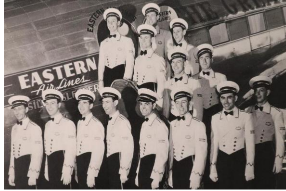
صورة رقم (2) تمثل زي المضيفين في شركة الخطوط الجوية الشرقية Eastern Airlines